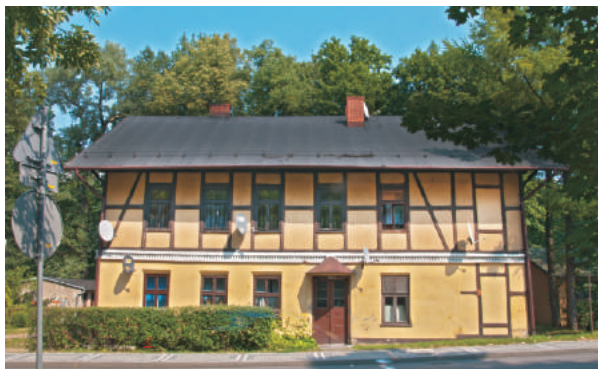
Zdjęcie: Budynek do rewitalizacji – Zdrojowa 30